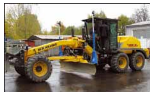
instalace systému na grader New Holland ve Žďaru n. S.